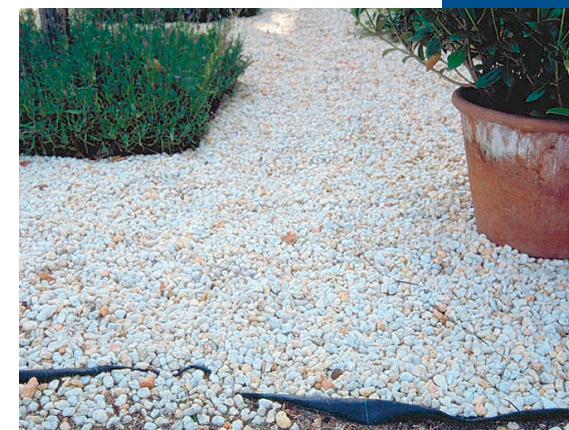
Géotextile sous les gravillons