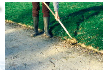
Binage des bordures d'allée

Pour les plus tenaces, utiliser un karcher haute pression. En ultime recours, utiliser un anti-mousse à base de D-limonène à condition de se protéger (il est irritant pour la peau et les yeux).