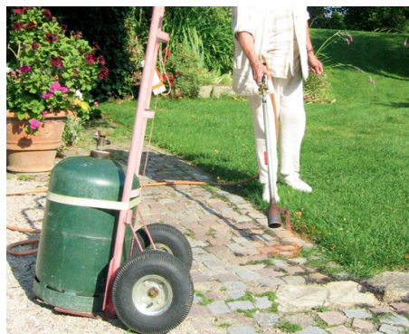
Désherbage au gaz