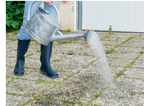
Le désherbage à l'eau bouillante : sûr et efficace

Désherber à l'eau bouillante : très efficace, sûr et parfaitement adapté aux petites surfaces. Ne pas attendre d'être envahi et intervenir dès les premières pousses. Penser à récupérer l'eau de cuisson des légumes. Epandre l'eau bouillante avec une casserole ou un arrosoir galvanisé.