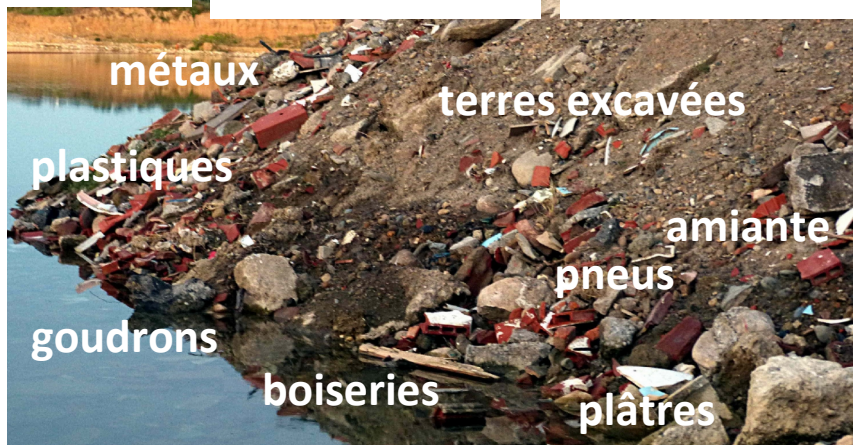
Denjean Ariège Granulats