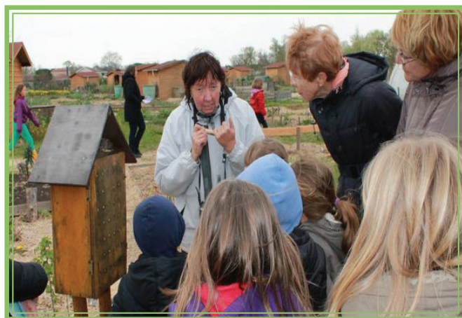
Animation autour d'un gîte à abeilles solitaires

L'association Les jardiniers de tournefeuille est née d'une initiative citoyenne : créer un jardin familial à vocation particulièrement sociale . Convaincu par le projet, le maire a mis à disposition de l'association un terrain de deux hectares.