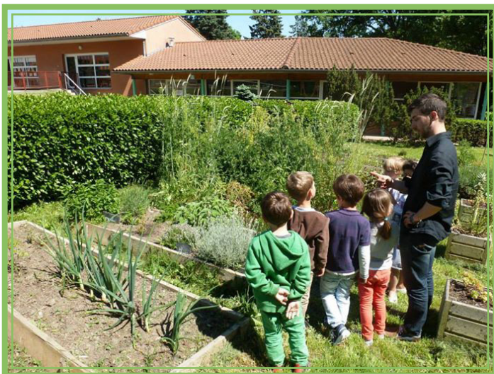
Animation jardin dans une école