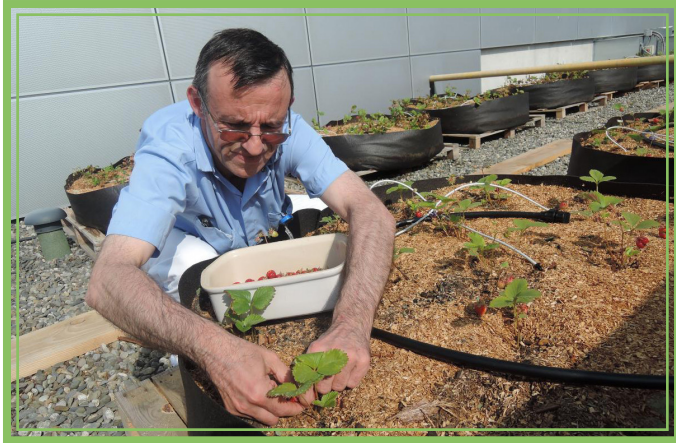
Entretien des plantations

Macadam Gardens a joué un rôle d'accompagnement auprès du club de jardinage qui s'est formé pour entretenir cet espace.